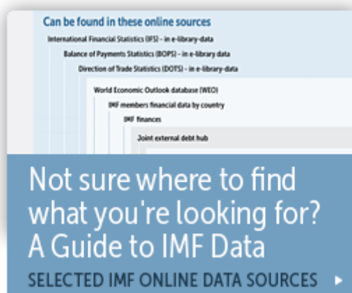
Figura C2. Guía de datos. Tomado de “Data,” por International Monetary Fund (IMF), 2016 ( http://www.imf.org/external/data.htm ).