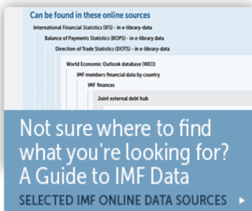
Figura C2. Guía de datos. Tomado de “Data,” por International Monetary Fund (IMF), 2016 ( http://www.imf.org/external/data.htm ).