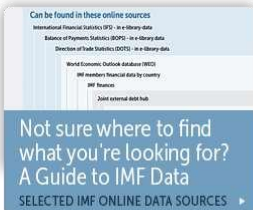
1. Figura C2. Guía de datos. 2. Tomado de “Data,” por International Monetary Fund (IMF), 2016 ( http://www.imf.org/external/data.htm ).